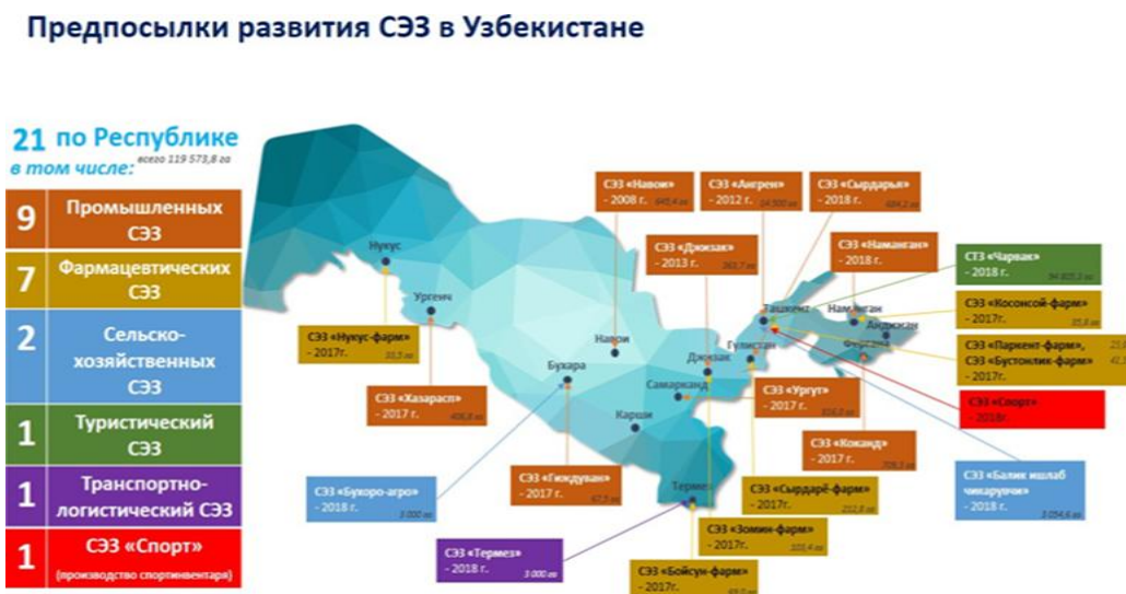
Рисунок 3. Предпосылки развития специальных экономических и индустриальных зон Республики Узбекистан

тельным условием является создание большого количества рабочих мест и в то же время развитие высокотехнологичных отраслей друг с другом (рис. 3).