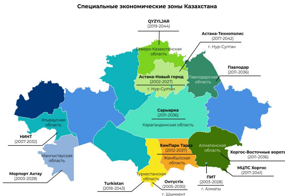
Примечание. Составлено автором на основе источника [3].

Как правило, СЭИИЗ — это географическая зона, которая в некоторой степени изолирована [2; 52]. Юридическое значение СЭИИЗ определяется действующим законодательством (рис.1)[3; 33].